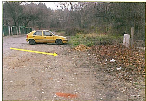
Közterület beépítetlen (értékelt eredeti állapot) nézete