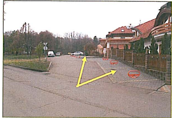
Közterület beépített része